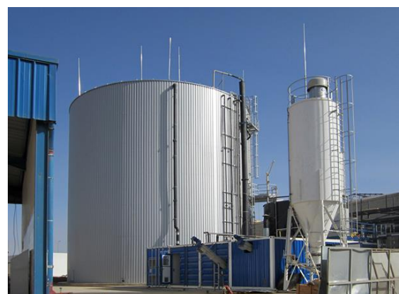
Mit der nachhaltigen Anlagenlösung werden Betriebskosten eingespart und Betriebskosten gesenkt

„Expertise ist wichtig“, unterstreicht Wiedenhaus. Molkereien sind oft historisch gewachsen, haben ganz individuelle Arbeitsprozesse und eigene Kreisläufe: „Wer hier helfen will, muss immer in maßgeschneiderten Lösungen denken und eigene Berechnungen beisteuern können.“ Gerade im Fall der Biogas-Erzeugung geht es schließlich meist darum, bestehende Abwasseranlagen zu erweitern und so nachzurüsten, dass die neuen Methoden gut integriert werden. „Nachhaltigkeit wird für Molkereien immer wichtiger“, sagt Wiedenhaus.