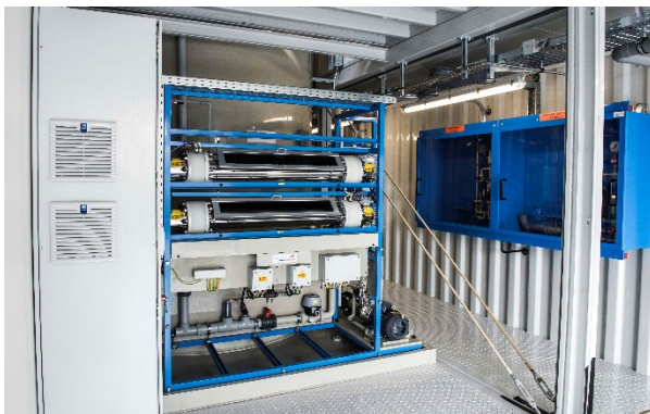
Entfernung der Pharmawirkstoffe (API) mittels UV und Wasserstoffperoxid

„Gängiger sind heute die eleganten AOP-Verfahren“, so Billenkamp. Also erweiterte Oxidationsprozesse („Advanced Oxidation Processes“), bei denen API oder andere schwer abbaubare Stoffe in kleinere organische Bruchstücke zerteilt werden. Denn viele der Stoffe bestehen aus langkettigen Molekülen, die von Bakterien in den Kläranlagen nicht aufgebrochen werden können.